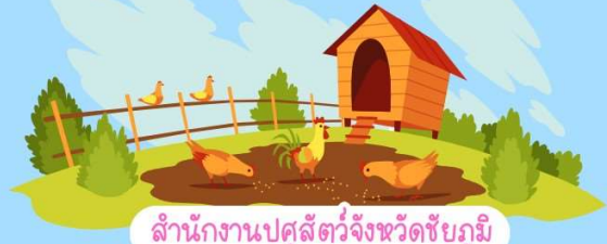
สำนักงานปศุสัตว์จังหวัดชัยภูมิ

เกษตรกรขึ้นทะเบียนปศุสัตว์ กับกรมปศุสัตว์ ก่อนเกิดภัยพิบัติ