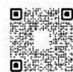
QR CODE : รายงานการประชุม สำนักงานปศุสัตว์จังหวัดอำนาจเจริญ

ฝ่ายบริหารทั่วไป ได้จัดทำรายงานการประชุมครั้งที่ 1/2569 เมื่อวันที่พฤหัสบดีที่ 25 ธันวาคม พ.ศ. 2568 แล้ว ขอให้ตรวจสอบรายงานการประชุมตาม QR CODE ด้านข้าง หากท่านใดมีความประสงค์จะแก้ไข ขอให้แจ้งต่อที่ประชุม หากไม่มีการแก้ไข ขอมติที่ประชุมให้รับรองรายงานการประชุม