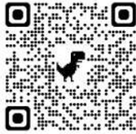
Qr code การประเมินตนเองของสำนักงาน ก.พ.

การวางแผนพัฒนาบุคลากรภาครัฐ กำหนดให้ข้าราชการและ พนักงานราชการเข้าไปประเมินตนเองได้ที่ https://dg-sa.tpqi.go.th ซึ่งเป็นช่องทางทางการประเมินตนเองของสำนักงาน ก.พ. เมื่อประเมินตนเองเสร็จแล้วให้ส่งหลักฐานในไลน์กลุ่ม IDP ภายในวันที่ 6 กุมภาพันธ์ 2569